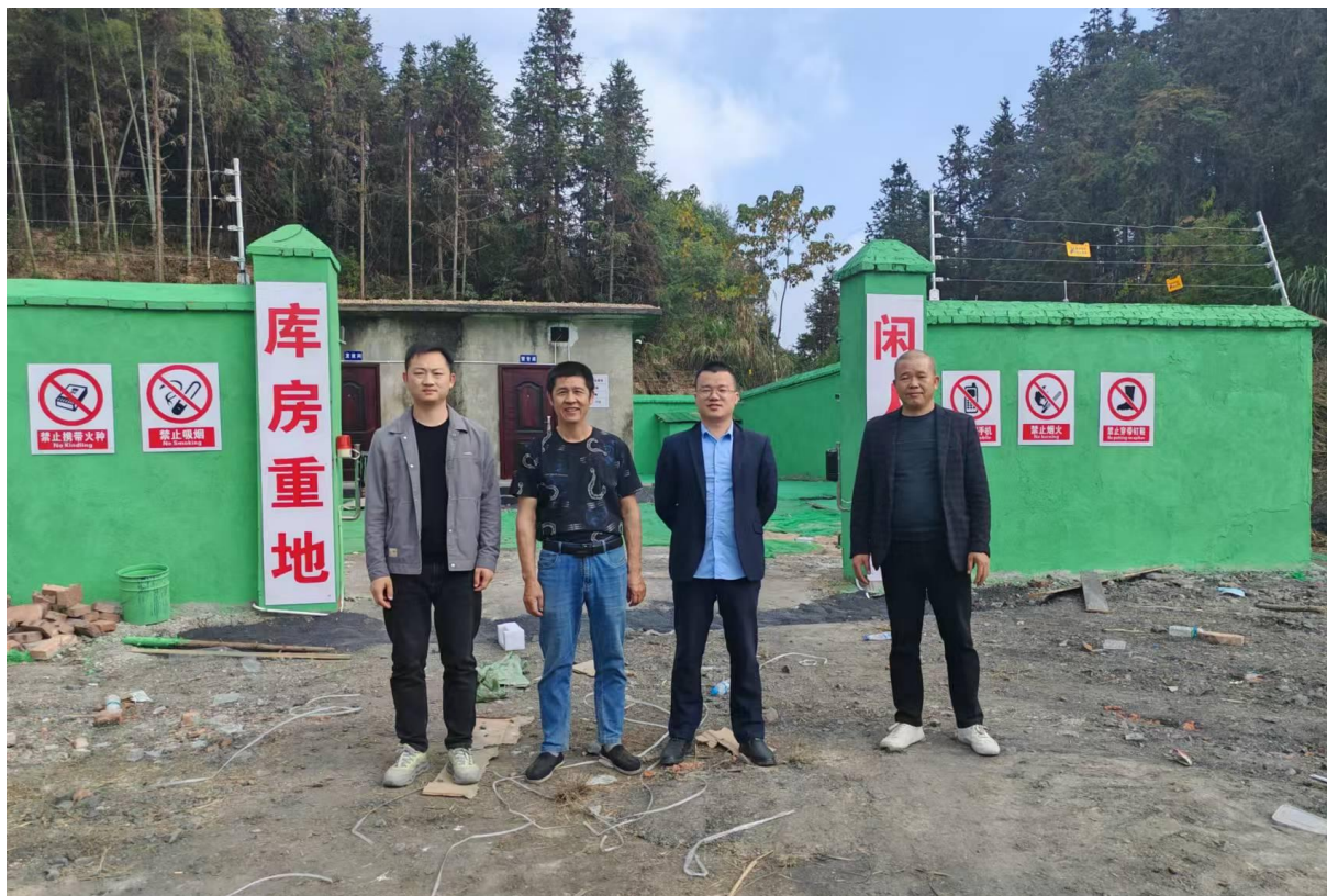
评价人员现场合影