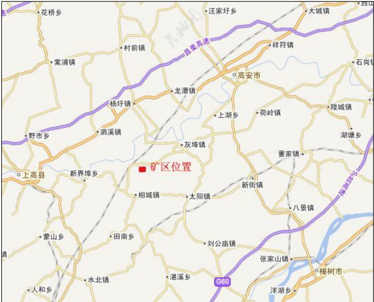
图 2-1 交通位置图

228°，直距 35km 处，处于灰埠镇石下村至相城岭背筒家一带，行政隶属灰埠镇和相城镇管辖。距八景镇约 35km，有县级公路相连，由八景镇的昌樟高速和浙赣铁路可达全国各地，交通方便。矿区交通位置如图 2-1。