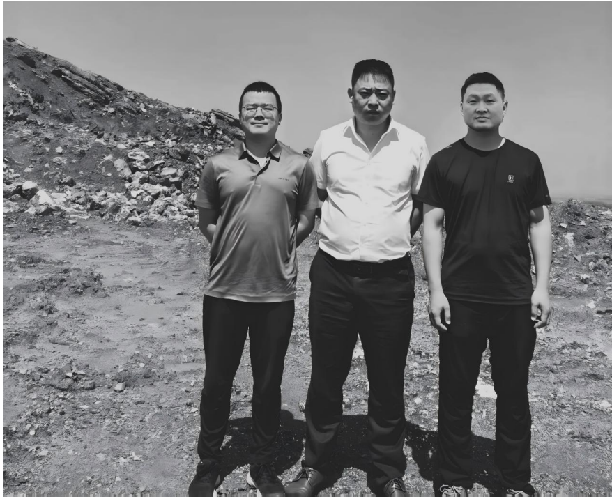
评价人员现场合影